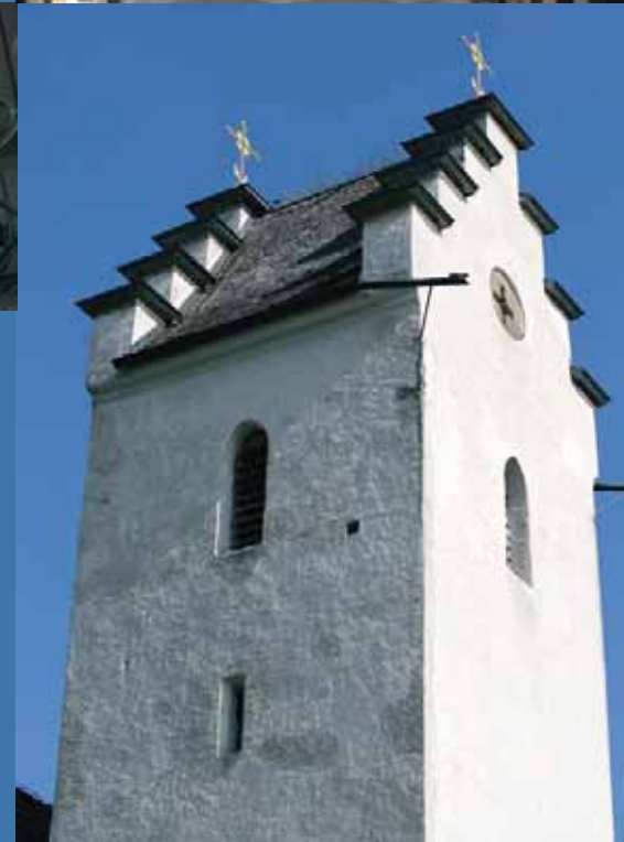
Die Kirche von St. Margarethen