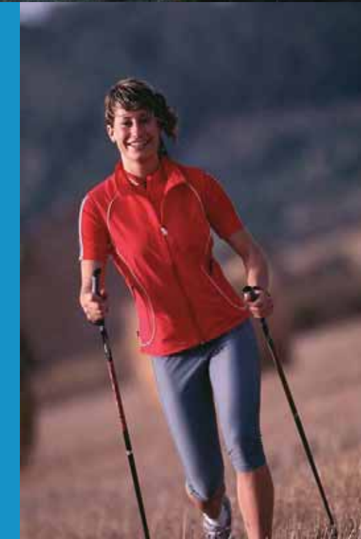
Fit bleiben beim Nordic Walking