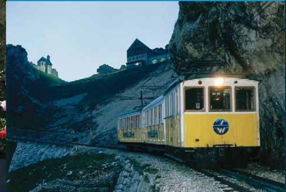
Mondscheinfahrt mit der historischen Zahnradbahn auf den Wendelstein