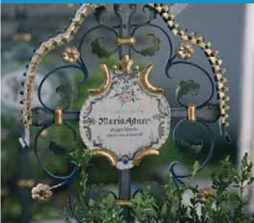
Grabkreuz am Friedhof von St. Margarethen