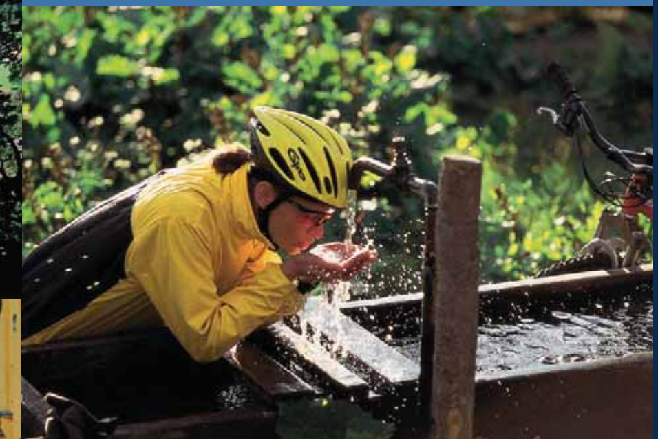
Erfrischung am Brunnen