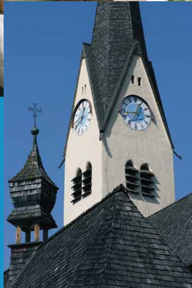
Die Kirche Mariä Himmelfahrt in Brannenburg