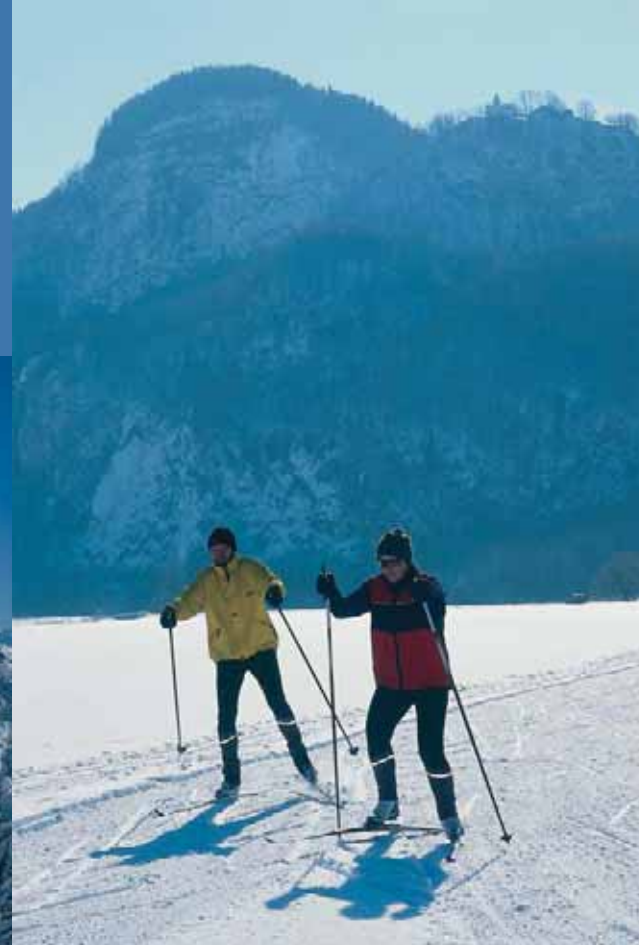
Viele Kilometer gespürte Loipen warten auf Langläufer aller Konditions- und Könnensstufen