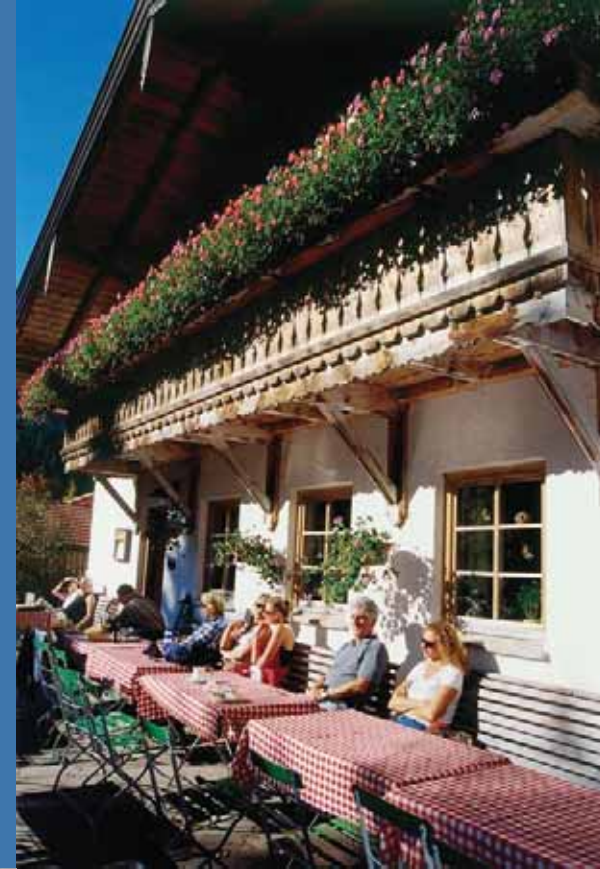
Auf einem Bankerl in der Sonne die Brotzeit genießen...