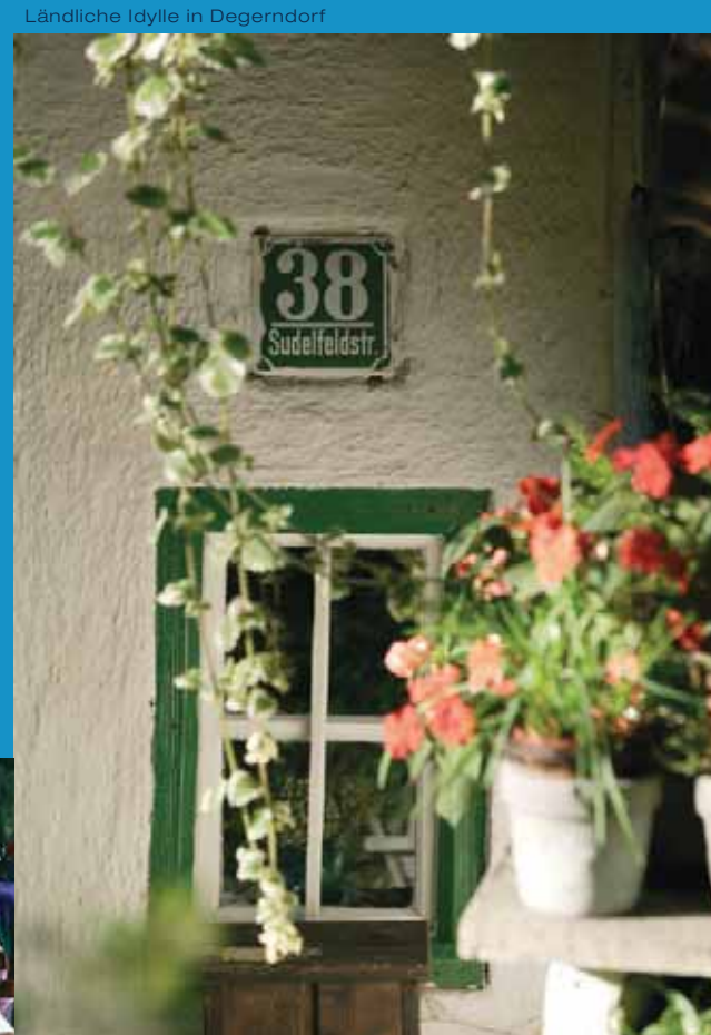
Ländliche Idylle in Degendorf