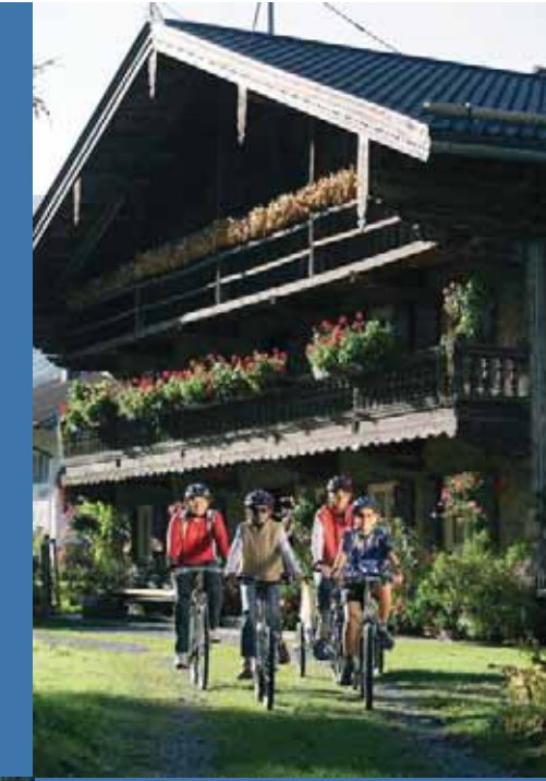
Ein Paradies für Radler