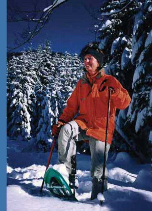
Schneeschuhwandern in unberührter Natur.