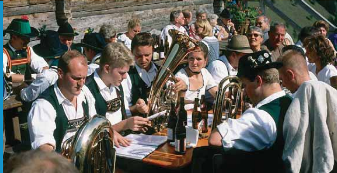
Volksmusik auf der Alm