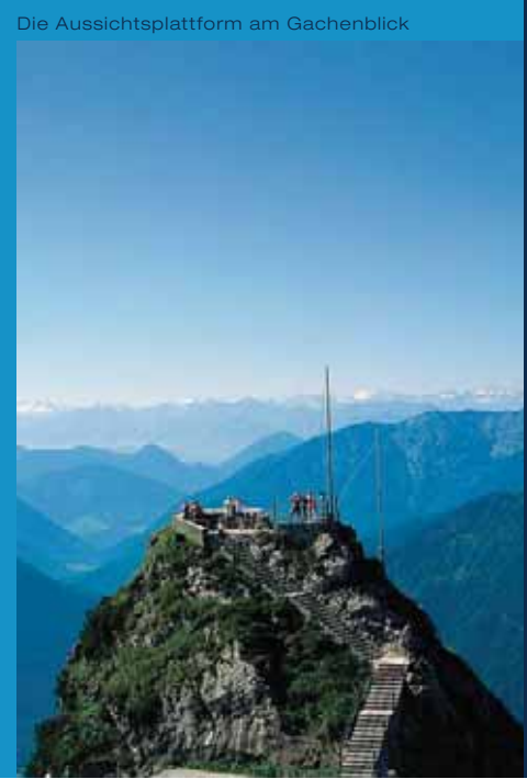
Die Aussichtsplattform am Gachenblick